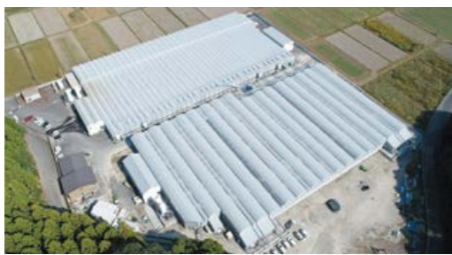
株式会社 西日本養鰻 第二事業所