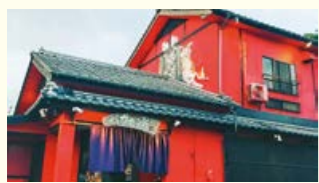
居酒屋 バガボンド 鹿屋店

〒893-0003 鹿屋市曾田町 5019-8 ☎0994-45-6128 店休日 不定休 営業時間 18:00～翌2:00