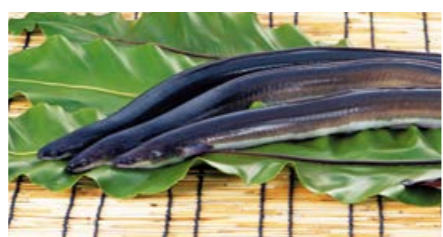
▲曾於市の第一事業所と串良町の第二・三事業所で、年間最大900tの総生産量を目指す