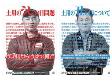
▲「土用のうしの日問題篇」の新聞広告

鹿屋市のふるさと納税を紹介ください！ ふるさと納税とは、ふるさとや応援したい自治体等に寄附することで、所得税や住民税が控除される仕組みのこと。集まった寄附金は事業に充てられ、まちづくりに役立てられています。本市へのふるさと納税の令和5年度寄附件数は約18万件で、寄附金額は35億1,404万5千円でした。 寄附者へのお礼の品としてお渡しする返礼品は、うなぎ、牛肉、黒豚、カンパチ、焼酎などの多種多様な特産品となっています。 ぜひ、市外にお住まいのお知り合いやご家族に、魅力ある鹿屋市のふるさと納税をご紹介します。