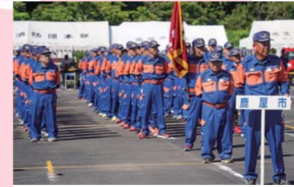
7月 肝属支部消防操法大会 肝属地区2市4町の代表が参加し、小型ポンプの部は鹿屋市平南分団、ポンプ車の部は鹿屋市野里分団がそれぞれ優勝しました。