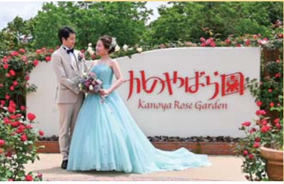
4月 かのやばら祭り2024春 5月11日には新婚夫婦が人前式、結婚2年目を迎えた夫婦が記念式を挙げる「ローズウェディング」が行われました。