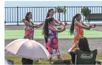
8月 輝★HOKU楽フェスinうわば フラダンスなどのステージショーに加え、キッチンカーや雑貨販売などで賑わい、約1,000人がフェスを楽しみました。