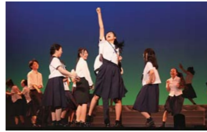
9月 高校生ミュージカル「ヒメとヒコ～ある王の物語～」 18年目を迎えた同ミュージカル。今年も多くの観客を演技や歌で魅了しました。