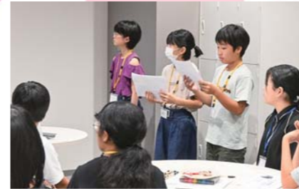
8月 かのやっ子委員会市長報告会 市内の小中学生16人がまちづくりのアイデアを市長に提案し、未来の鹿屋について意見交換を行いました。