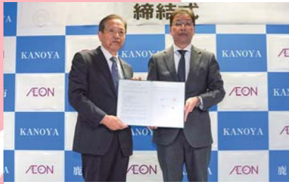
11月 イオン九州㈱との地域連携協定締結式 幅広い分野で協力し、地域の活性化と市民サービスの向上を目指します。