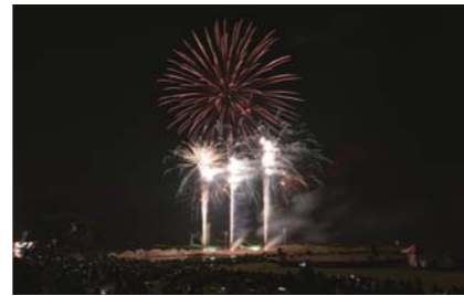
10月 大隅湖レイクサイドフェスティバル2024 色とりどりの花火とレーザーが湖面と夜空を彩り、多くの人を楽しませました。