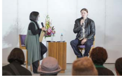
3月 協力隊まつりかごしま2024 JICA海外協力隊と地域おこし協力隊による初開催イベント。俳優の村雨辰剛さんのトークショーも行われ、会場を盛り上げました。