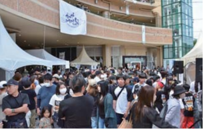
5月 かのやMeets2024 (北海道と鹿児島島の恵の祭典) 食と文化を通じた地域の交流を目的に初開催され、約1万1,000人が来場しました。