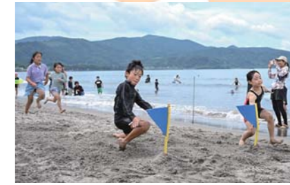
7月 かのやマリノフェスタ2024 ウィンドサーフィンやバナナボート体験のほか、砂浜ではビーチサンダルとばしや綱引き大会などが実施されました。