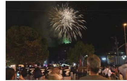
8月 かのや夏祭り 33チーム約2,600人の踊り連が市街地を練り歩き、踊り手と来場者約4万8,000人が一体となって祭りを盛り上げました。