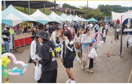
11月 星のふるさと輝北まつり2024 輝北町文化協会による舞台発表や地元農産物の販売などのほか、演歌歌手の杜このみさんによる歌謡ステージも披露されました。