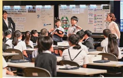
10月 九州地区英語教育研究大会（鹿児島大会）小・中学校の部 鹿屋小・中学校が公開授業を行い、英語で本市の魅力を発表しました。