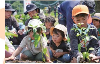
6月 かみのチャレンジファーム開園式 旧神野小学校周辺の農地で今年初開催された親子農業体験「かみのチャレンジファーム」の開園式が行われました。