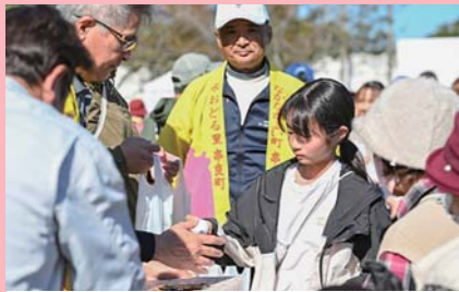
11月 くしら黒土祭り 地元産牛肉をはじめとした農産物の即売のほか、恒例の卵のつかみ取りでは朝から長蛇の列ができました。