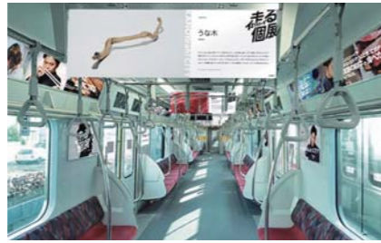
10月 東急田園都市線で「走る個展」を開催 池崎慧氏の広告で電車をジャック。12月には市鉄道記念館の車両でも展示を実施。