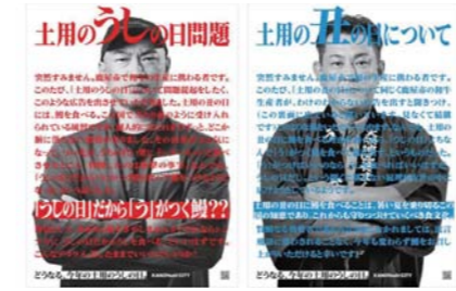
9月 「新聞広告賞」の大賞受賞 日本新聞協会「第44回新聞広告賞」の大賞に「土用の『うしの日』問題」（令和5年7月掲載）が選出されました。