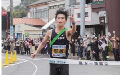
2月 鹿児島県下一周市郡対抗駅伝競走大会郷土入りで日間優勝 郷土入りとなる4日目は、106.3kmの距離を10人で走り見事日間優勝を果たしました。