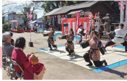
3月 美里吾平ひな祭り お菓子の振る舞いや雅楽演奏・巫女舞のほか「劇団ニライスタジオ」による創作演舞が披露されました。