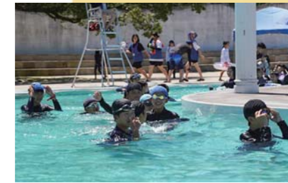
7月 アクアゾーンくしらが5年ぶりにオープン 流るプールやウォータースライダーを満喫する多くの人で賑わいました。