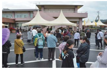
11月 美里あいら農業祭 吾平生まれ鹿屋育ちの鹿児島黒毛和牛を農業祭特別価格で販売するなど、イベントや出店コーナーは大勢の人で賑わいました。