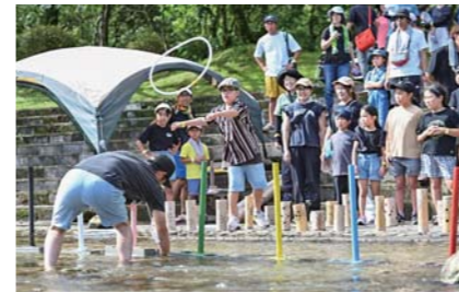
9月 かみのゴッドフェス～競宴～ 神野スマイル協働隊が主催した、子どもから大人まで楽しめる競技参加型イベント。豊かな自然に触れながら競技を楽しみました。