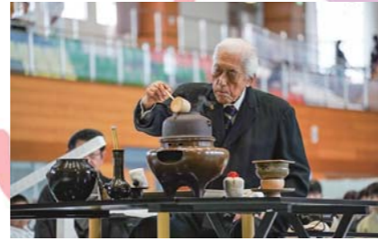
9月 平和祈念献茶式 徳島白菊特攻隊に所属していた茶道裏千家の前家元である千玄室大宗匠が献茶の儀を行い、お茶をささげて仲間の冥福を祈りました。