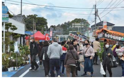
1月 名物あいら木市祭 4年ぶりの開催となった、名物あいら木市祭。吾平町商店街に県内外から植木・苗木業者など約40店舗が出店しました。