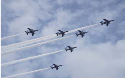
4月 エアーメモリアルinかのや2024 基地開隊70周年の節目を迎え、10年ぶりにブルーインパルスが来歴し、鹿屋の上空で迫力あるアクロバット飛行を披露しました。