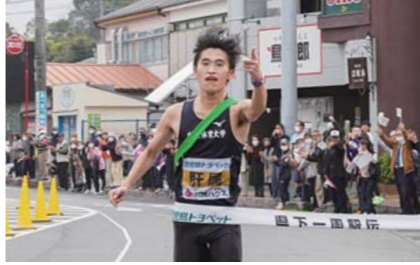
2月 鹿児島県下一周市郡対抗駅伝競走大会郷土入りで日間優勝 郷土入りとなる4日目は、106.3kmの距離を10人で走り見事日間優勝を果たしました。