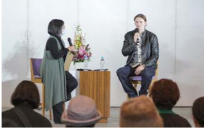
3月 協力隊まつりかごしま2024 JICA海外協力隊と地域おこし協力隊による初開催イベント。俳優の村雨辰剛さんのトークショーも行われ、会場を盛り上げました。