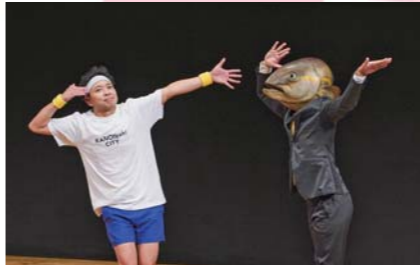
2月 サンシャイン池崎の爆裂凱旋ギャラクシー!〜鹿屋よりイエイをこめて〜 本市出身のサンシャイン池崎さんが鹿屋では初となるお笑いライブを開催しました。