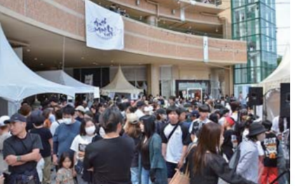
5月 かのやMeets2024<北海道と鹿児島島の恵の祭典> 食と文化を通じた地域の交流を目的に初開催され、約1万1,000人が来場しました。