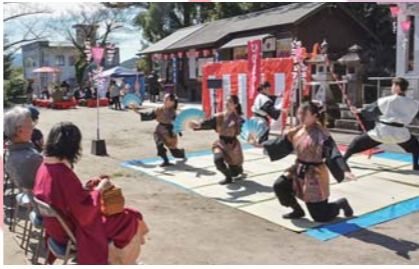
3月 美里吾平ひな祭り お菓子の振る舞いや雅楽演奏・巫女舞のほか「劇団ニライスタジオ」による創作演舞が披露されました。