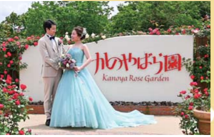
4月 かのやばら祭り2024春 5月11日には新婚夫婦が人前式、結婚2年目を迎えた夫婦が記念式を挙げる「ローズウェディング」が行われました。