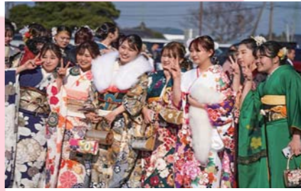
1月 鹿屋市二十歳のつどい 令和5年度に二十歳を迎える778人が参加。式典では実行委員会による記念制作映像「二十年のキセキ」が放映されました。