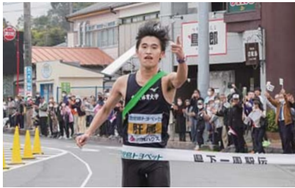
2月 鹿児島県下一周市郡対抗駅伝競走大会郷土入りで日間優勝 郷土入りとなる4日目は、106.3kmの距離を10人で走り見事日間優勝を果たしました。