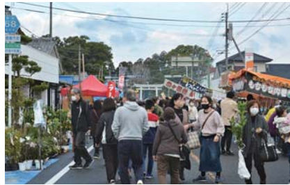
1月 名物あいら木市祭 4年ぶりの開催となった、名物あいら木市祭。吾平町商店街に県内外から植木・苗木業者など約40店舗が出店しました。