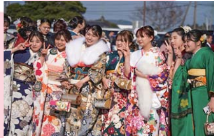
1月 鹿屋市二十歳のつどい 令和5年度に二十歳を迎える778人が参加。式典では実行委員会による記念制作映像「二十年のキセキ」が放映されました。