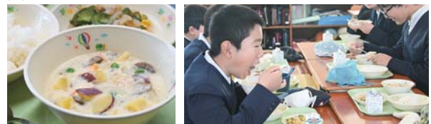
下名小学校での給食の様子(さつまいもシチュー)

●学校給食でのさつまいもの提供 学校給食で鹿屋産のさつまいもを提供することで、おいしいおいもの周知及びシビックプライドの醸成を図ります。