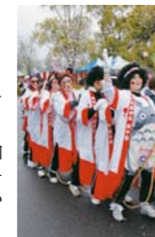
仮装の部で優勝した「ニコニコママ」

ジョギング大会には、4種目に801人が参加して健脚を競いました。また、くしらん坊レースには、5部門に37チームが参加。賞金をかけて、激しいレースが繰り広げられました。「ジョギング大会」の優勝者と「くしらん坊レース」の優勝チームは右のとおり。（敬称略）