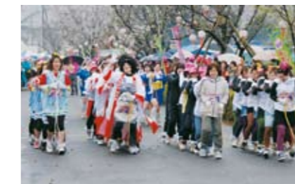
様々な仮装で審査員にアピール