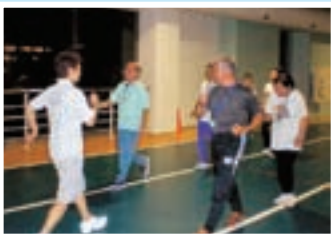
元気アップ教室の様子