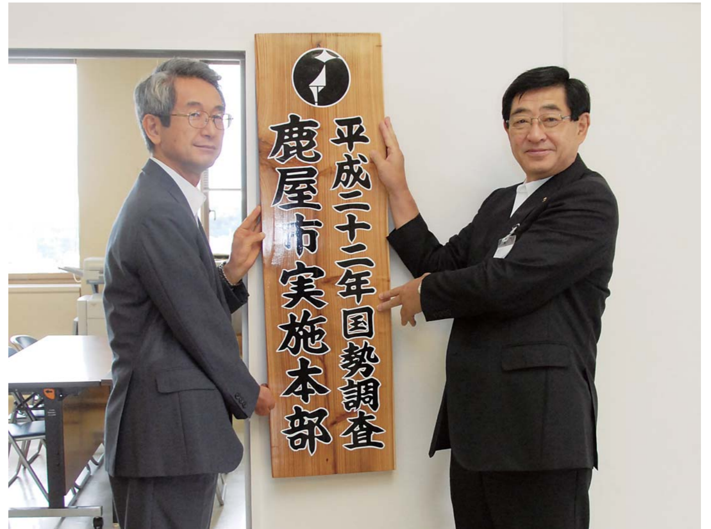
6月1日、平成22年国勢調査鹿屋市実施本部を市役所内に設置しました。この本部で鹿屋市内の国勢調査に関することが円滑に行われるよう準備を進めています。