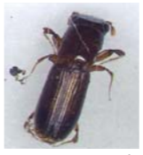
▲カシノナガキクイムシ(体長約5mm)