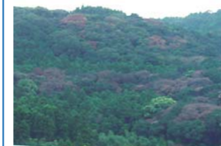
▲茶色の木が被害をうけて枯れたマテノキなど

現在、市内各地でマテノキなどの広葉樹が枯れる被害が発生しています。カシノナガキクイムシと呼ばれる体長5mm程度の虫が原因とされています。 今後、被害状況調査を行いますので、住居近辺で枯れているマテノキなどを発見した場合は、お知らせください。 市民の皆さんのご協力をお願いします。