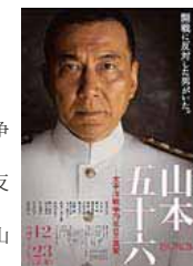
映画「聯合艦隊司令長官 山本五十六」

昭和初期からあの戦争が始まるまでの10数年。最後まで日米開戦に反対し続けた人物がいた。聯合艦隊司令長官、山本五十六。 上映期間 〓3月3日(土)～23日(金) 上映時間 (140分) ①10時 ②13時 ③16時 ④19時 鑑賞料 一般 〓1,800円 高・大学生 〓1,500円 中学生以下 〓1,000円 60歳以上 〓1,000円 ※上映期間・時間、鑑賞料は変更する場合があります。 リナシティかのや ☎0994-351001