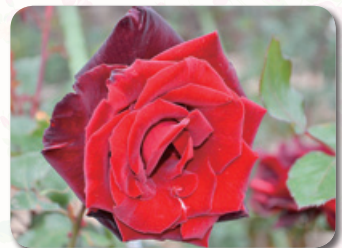
フェアリーガーデン内

少女マンガの傑作と同じ名前が付けられた真紅の大輪花。他を圧倒する華やかな同バラは、情熱的な「ベルサイユのばら」の世界そのものです。