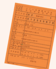
▲新しい受給資格者証