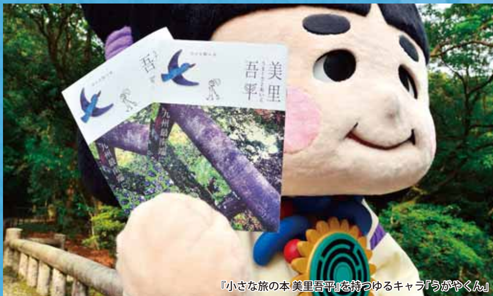
『小さな旅の本 美里吾平』を持つゆるキャラ「うがやくん」