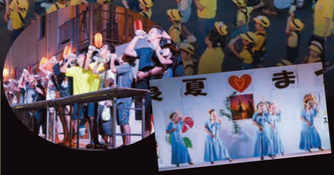
◎かのや市商工会夏祭り実行委員会(串良本所内) ☎ 0994-63-3032