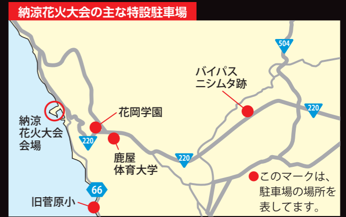
◎かのや夏祭り実行委員会(鹿屋商工会議所2階) ☎ 0994-42-6690