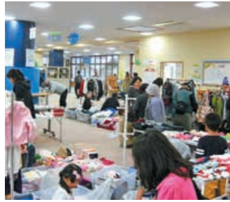
▲昨年の環境ふれあい館まつり

●肝属地区環境ふれあい館 〒0994-62-8101 FAX 0994-62-8102 ●申込期限 10月11日(水) 13時