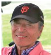
審査講評 写真家 浅井 慎平 氏

「かのや『ばら』と『海』フォトコンテスト2018」は、かのやばら園の「ばら」と鹿屋の「海」のすばらしさを全国に向けて情報発信しようとして毎年行っているもので、今年は県内外から応募のあった420点(ばらの部327点、海の部93点)の作品を審査し、グランプリ2点をはじめ26点の入賞作品を決定しました。問 市都市政策課公園管理室 Tel. 0994-31-1150