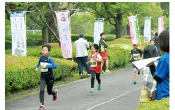
桜の残る並木道を 駆け抜ける

4月6日、小塚公園慰霊塔前広場で、「第62回旧鹿屋航空基地特別攻撃隊戦没者追悼式」が開催されました。満開の桜の下で行われた今年は、県内外から390人が参列。式典では、特攻隊員の遺族・関係者らによる献花や、隊員の遺書・平和へのメッセージの朗読、元隊員らによる「同期の桜」の合唱などが行われ、参列者は恒久平和を願いました。