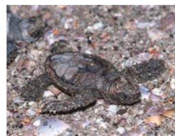
産卵後、「カメのゆりかご」に卵を移設するときの様子。【右】ふ化し、成体になるのは5千匹に1匹といわれている。【左】

併せて行います。40代の頃から高須小学校でウミガメをふ化させ、海に帰すボランティアとして活動していたことがきっかけで、平成18年から市のウミガメ保護監視員として、活動を続けています。昔と比べると砂浜が減少しており、ウミガメが上陸しても産卵しにくい環境になってきているのではないかと感じています。産卵に適した砂浜を維持していくことが、最も重要なことだと考えています。