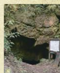
吾平町上名の「隠れ念仏洞穴」。岩屋の高さは1mほどで、人が掘った跡がある。

明暦2年(1656年)、薩摩藩は一向宗の摘発を行うために、鹿児島城下に宗門改所を設け、各郷にも宗門係を設置。名前や宗派等を書いた木札を身分証明書とし、これをたびたび取り替える「手札改め」を実施しました。その後も残酷極まりない厳しい取り締まりが長年継続されたことから、信者たちは改宗したように見せかけ、隠れて信仰していました。