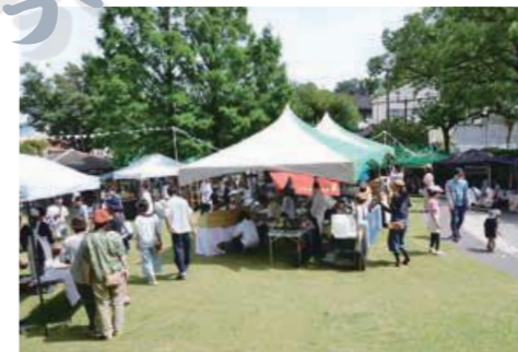
城山公園では現在、毎月第4日曜日に「食と暮らしのマルクト@おおすみ」が開催されている。

昭和35年に完成したこのプールは、全長50mで9コースを備える、当時は県内でも数少ない長水路プールでした。写真は「市民水泳大会」の様子です。夏休みの時期には多くの利用者でにぎわっていましたが、湧き水のため非常に冷たかったといえます。緑豊かな公園へと姿を変えた現在でも、市民の憩いの場として親しまれています。