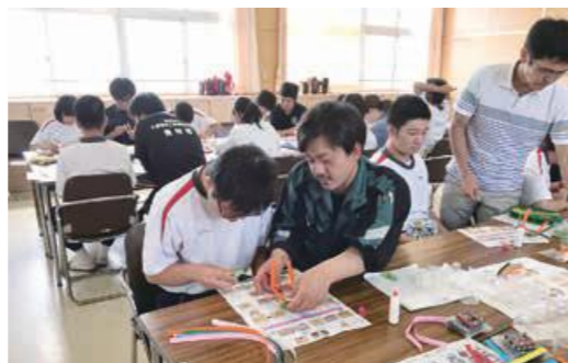
青年部が昨年開催した工作教室。生徒たちは電気の仕組みを学びながら工作を楽しみました。

憩いの空間が広がる吾平山陵公園。吾平山上陵は、参道脇の始良川が伊勢神宮の五十鈴川と似ていることなどから、「小伊勢」とも呼ばれています。夏は、川遊びや清掃活動等で川に親しむ機会が増える季節。皆さんも身近な川のことを学んでみませんか。なお、川に近づく際は、くれぐれもご注意ください。