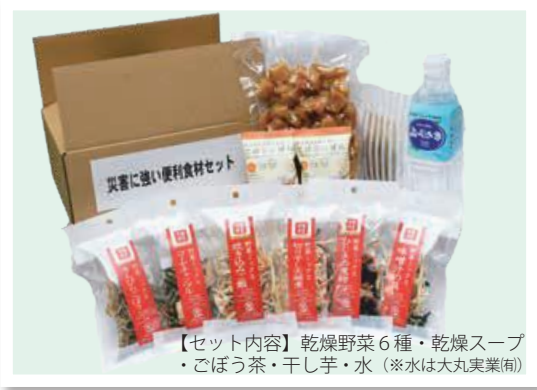
【セット内容】乾燥野菜6種・乾燥スープ ・ごぼう茶・干し芋・水（※水は大丸美業㈱）