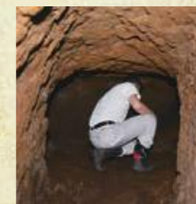
輝北町諏訪原の「隠れ念仏洞穴」。天井が低く、読経が漏れないようにジグザグに作られている。

信者だということが発覚すると、ほかの信者を探し出すために、厳しい拷問にかけられました。強い信仰心で信者たちは決して口を割りませんでした。市内には今もなお、隠れ念仏の洞穴などが残っており、厳しい禁制の歴史と信仰の偉大さを伝承し続けています。