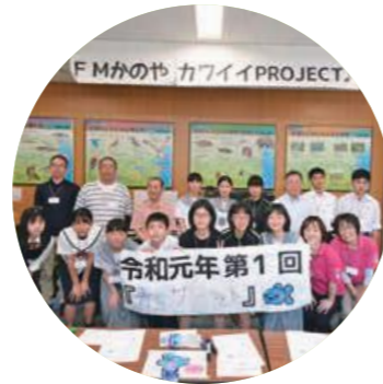
F Mかのや カワイイPROJECT