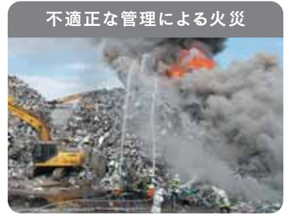
不適正な管理による火災

廃家電は電池やプラスチックを含むため、発火・延焼の危険性があり、不適正な管理による火災が発生しています。