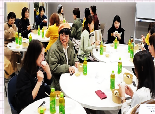
▲ランチ交流会の様子