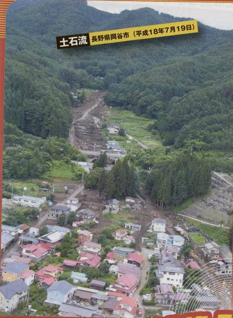
土石流 長野県岡谷市 (平成18年7月19日)