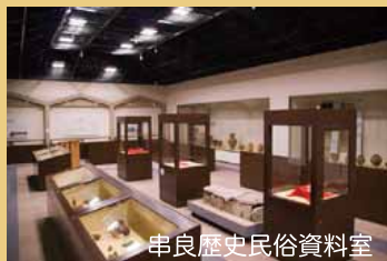
串良歴史民俗資料室