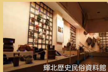
輝北歴史民俗資料館