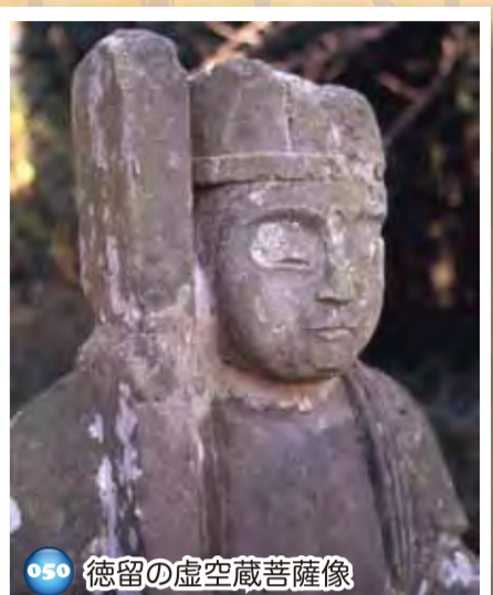
050 徳留の虚空蔵菩薩像

イチョウは周囲9m、高さ19.8m、寄り添うように立つモミの木とイヌマキは、モミが周囲4.75m、高さ32.8m、イヌマキは周囲3.75m、高さ22m。いずれも樹齢は400年以上とされる。