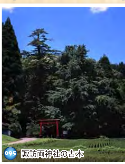
095 諏訪両神社の古木

笠野原台地はシラス土壌のため飲み水や農業用水に困っていた。そこで人々は井戸を掘って生活用水などに使った。この深井戸は64mと深く、牛にロープを引かせ、つるべて水をくんでいた。