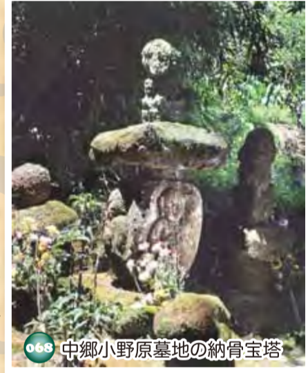
068 中郷小野原墓地の納骨宝塔

鎌倉時代から戦国時代にかけて肝付氏と雷山氏による地域の開田作業や戦乱の時の供養塔群で、洞穴の中に約90基の石塔が並んでいる。