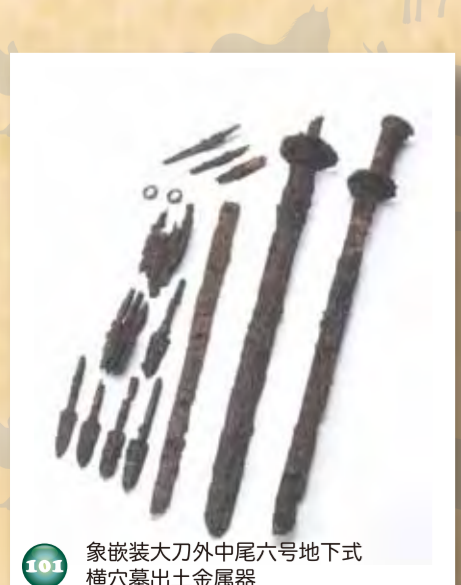
101 象嵌装大刀外中尾六号地下式横穴墓出土金属器

約1,500年前のもの。ツバとハバキに心葉文(ハート形)、柄頭部分に二重半月文の銀象嵌が施されている。あわせて、3体の人骨、多数の鉄製品が出土した。