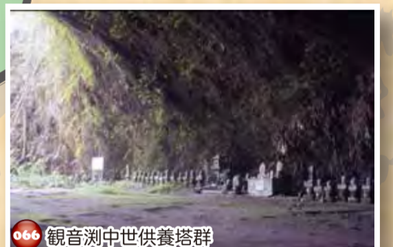
066 観音淵中世供養塔群

蓮の上に片ひざを立て、頬づえをついた均整の取れた美しい観音像。台座に享保六年(1721年)の刻みがある。