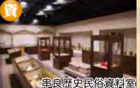
串良歴史民俗資料室