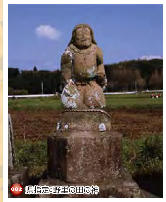
002 県指定:野里の田の神

1751年(寛延4年)の作で鈴持ち田の神舞型では最も古いものとされる。コシキを頭巾風にかぶり、袖の長い上衣を着ている。右手にシャモジを、左手に舞用の鈴を持っている。