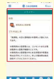
▲ごみの出し方をすぐ に教えてください!