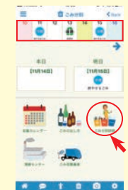
▲「ごみ分別辞典」 があります