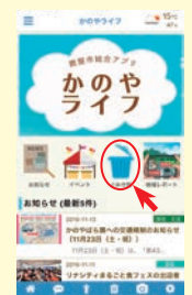
▲「かのやライフ」 トップ画面

市公式アプリ「かのやライフ」で、ごみに関する情報を簡単にチェックできます。ごみ収集カレンダーやごみの出し方の確認ができるうえ、物品ごとの分別方法を検索することもできますので、ぜひご活用ください。また、これらの情報は市ホームページでも確認できます。