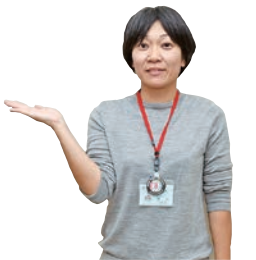
市生活環境課 こおりやま 郡山 ごみ分別指導員

大掃除が終わったあとに行うのは出たごみの分別。ごみは分別後の種類によって捨て方が変わります。ごみの分別方法は市ホームページや市公式アプリ「かのやライフ」にも掲載していますので、分別の種類を覚えましょう。 市生活環境課 Tel 0994-31-1115