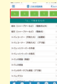
▲物品を頭文字で 検索すると...