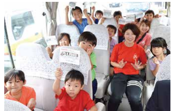
くるりんバスの新2ルート運行開始

10月9日、障害者支援施設ゆりり(串良町有里)で、「生きがいづくり型ドライブサロン事業」が始まりました。この事業では毎月2回、交通手段を持たない串良地域の高齢者等を対象に、施設の大型バスを使い、観光や買い物などへの移動を支援。同時に利用者の健康チェックも行うほか、利用者同士との交流が深まることで地域の支え合いも期待されています。