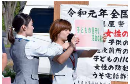
みんなでつくる安全安心なまち

10月11日、寿一里山交差点の周辺で、「令和元年全国地域安全運動」の出発式が行われました。式では、地域の金融機関の女性職員を中心に構成される「金防協レディーズ」の会員らが、防犯対策を紹介するパネルを掲げながら「防犯一口講話」を行ったほか、寿北小学校の児童が安全宣言を行うなど、地域の安全を誓いました。