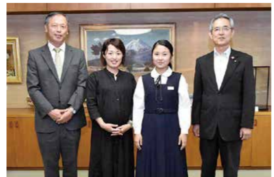
英語の弁論大会で全国の舞台へ

10月11日、寿一里山交差点の周辺で、「令和元年全国地域安全運動」の出発式が行われました。式では、地域の金融機関の女性職員を中心に構成される「金防協レディーズ」の会員らが、防犯対策を紹介するパネルを掲げながら「防犯一口講話」を行ったほか、寿北小学校の児童が安全宣言を行うなど、地域の安全を誓いました。