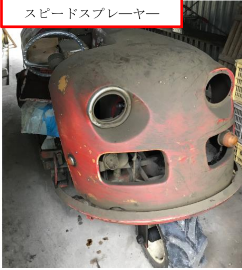
スピードプレーヤー