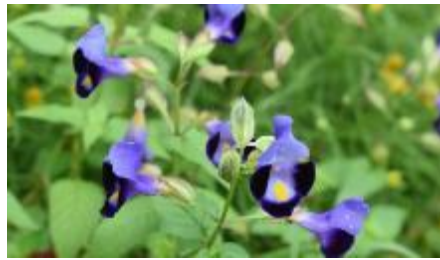
トレニア (夏スマイレ)