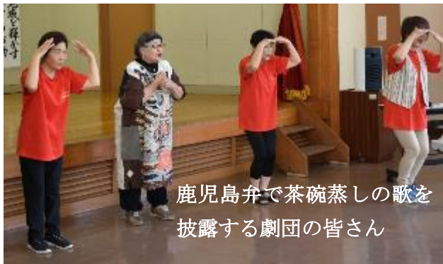
鹿児島弁で茶碗蒸しの歌を披露する劇団の皆さん