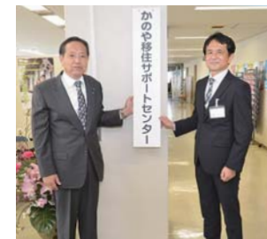
▲開設式で看板を設置する中西市長（左）と、かのや移住サポートセンター所長（右）

※4月16日、全国に緊急事態宣言が発令されたことを受け、県外在住者からの相談は電話・メールのみの対応としております。