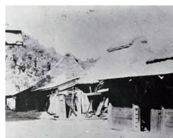
火山灰が積もった民家(現在の輝北町上百引)