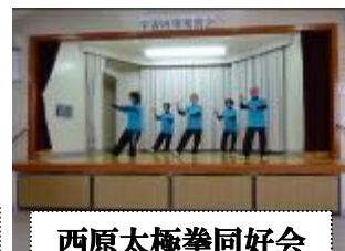
西原太極拳同好会