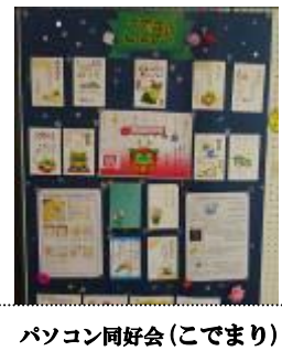
パソコン同好会(こでまり)