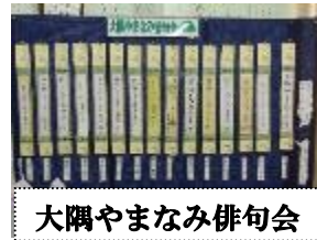
大隅やまなみ俳句会