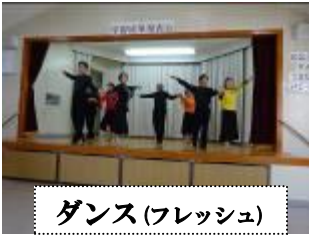
ダンス(フレッシュ)