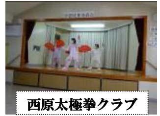
西原太極拳クラブ