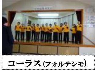
コーラス(フォルテシモ)