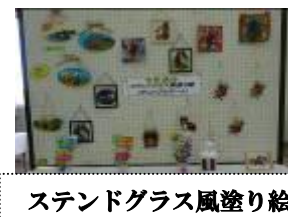
スタンドグラス風塗り絵