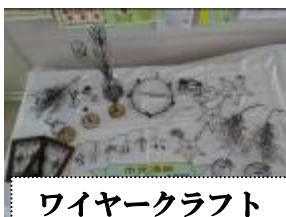
ワイヤークラフト