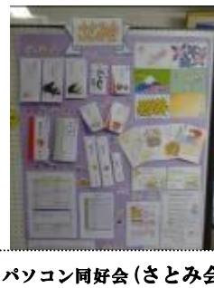
パソコン同好会(さとみ会)