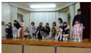
親子でわくわくリトミック