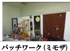
パッチワーク(ミモザ)