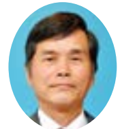
松野 清春 議員 (無所属)

相談窓口については、市民課の市民総合相談室を中心に、相談内容により、それぞれの担当課で対応し、案件によっては、国、県の機関等を紹介している。特に、若者の相談対応については、厚生労働省の認定する若者サポートステーション(おおすみ相談室)、県のかごしま子ども若者総合相談センターがあることから、関係機関との十分な連携を図りながら虐待防止に努めてまいりたい。