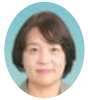
西蘭 美恵子 議員 (政伸クラブ)