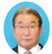
眞島 幸則 議員 (社民・民主・市民連合)