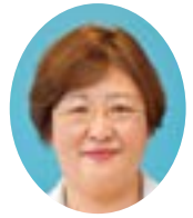
児玉 美環子 議員 (公明党)