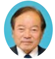
柴立 俊明 議員 (日本共産党)