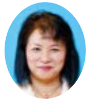
米永 淳子 議員 (社民・民主・市民連合)