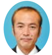
福田 伸作 議員 (公明党)