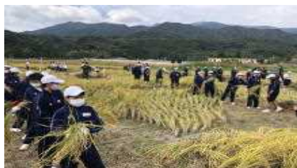
【田植え・稲刈り体験学習】

令和2年度より、校区内の高隈小、大黒小との合同運動会を開催し、子どもたちの自主的な運営で競技に取り組んでいます。