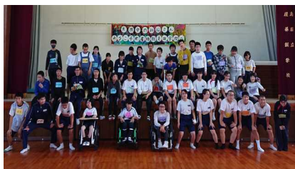
【鹿屋特別支援学校との交流会】

コミュニティ協議会の協力のもと、校区の園児や児童とふれあう中で思いやりの気持ちを培います。