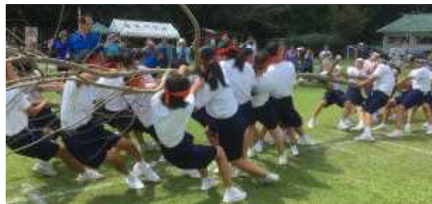
【伝統を引き継ぐ「かぎ引き」】