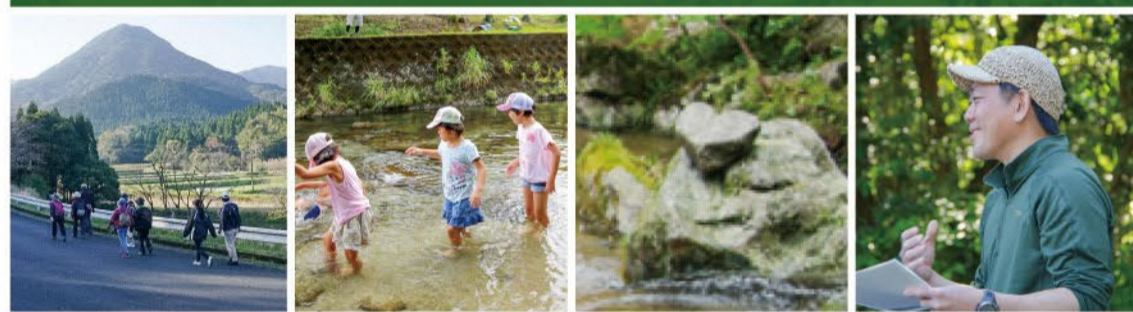
神野アウトドアガイドブック