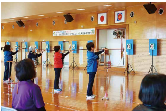
かごしま国体に向け 県内初の吹矢大会

11月27日、鹿屋市武道館で「第1回鹿児島県スポーツウエルネス吹矢選手権大会」が行われました。本大会は来年に開催予定の「燃ゆる感動かごしま国体」に向けて県内で初開催されたもの。大会には県内の有段者95人が参加し、会場には競技に集中した参加者の吹矢の発射音だけが響きわたるなど緊張感のある空気に包まれました。