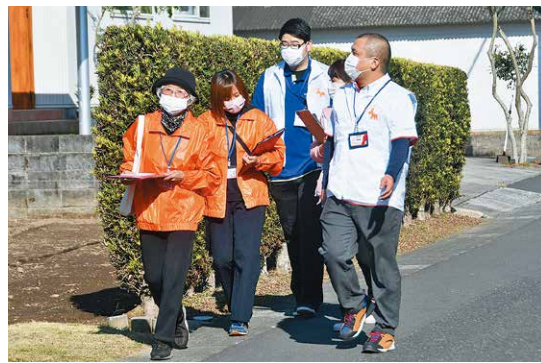
高齢者の安心安全 のために

11月27日、鹿屋市武道館で「第1回鹿児島県スポーツウエルネス吹矢選手権大会」が行われました。本大会は来年に開催予定の「燃ゆる感動かごしま国体」に向けて県内で初開催されたもの。大会には県内の有段者95人が参加し、会場には競技に集中した参加者の吹矢の発射音だけが響きわたるなど緊張感のある空気に包まれました。