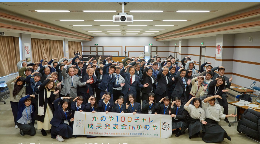
第9回 かのや100チャレ 成果発表会 in 鹿屋