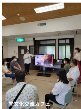
異文化交流カフェ