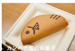
カンパチ型のお菓子