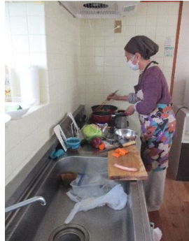
【産前産後の家事支援】