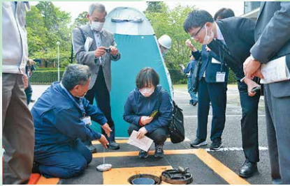
4月 鹿屋市防災会議 多くの関係機関と市武道館駐車場のマンホールトイレなどの現地視察を実施。出水期を前に防災対策を確認しました。