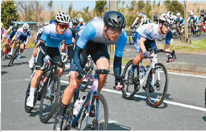
2月 JBCF鹿屋・肝付ロードレース大会 大隅広域公園周辺特設コースで国内最高峰の自転車ロードレースを開催。多くの市民が迫力あるプロの走りを観戦しました。