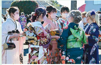
1月 鹿屋市二十歳のつどい 成人年齢が18歳に引き下げられたことから、名称が成人式から「二十歳のつどい」へ変更され、726人が参加しました。