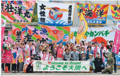
5月 海外クルーズ船オプショナルツアー マリンポート鹿児島で3月9日に海外クルーズ船の寄港が再開した後、鹿屋港を利用したツアー受け入れが行われました。