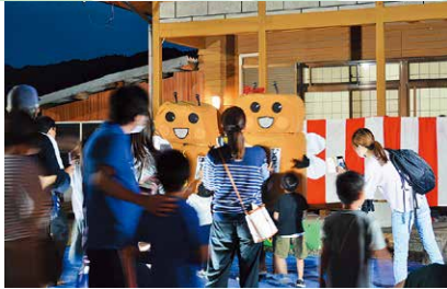
5月 ひらぼうほたるの里ほたる祭り 「ひらちゃん・ほうちゃん」の飛行式やじゃんけん大会などの催しの後、参加者は幻想的なホタルの光を觀賞しました。