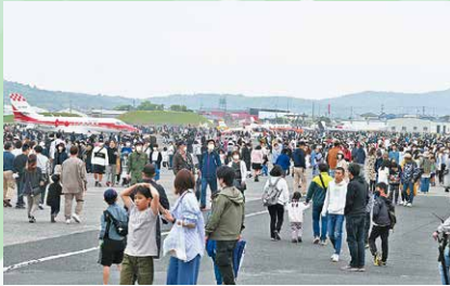
4月 エアメモリアルinかのや 2023 4年ぶりの開催で、航空ショーや小学生とP-1哨戒機との綱引きなどが行われ、約1万9,000人が来場しました。