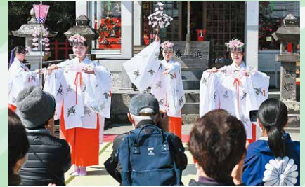
3月 美里吾平ひな祭り ひな人形の展示や雛あられのプレゼント、巫女舞いや雅楽演奏など、春らしい華やかなイベントになりました。