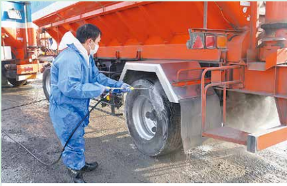
2月 高病原性鳥インフルエンザ発生に伴う消毒ポイント設置 消毒ポイントを市内4か所に設置して、畜産関係・一般車両の消毒を行いました。

今年は長いコロナ禍が去ったものの、不安定な国際情勢を背景とした紛争や物価高騰など、我々を取り巻く情勢が大きく変容した1年となりました。本市にとっても特別となったこの1年間を、写真とともに振り返ります。