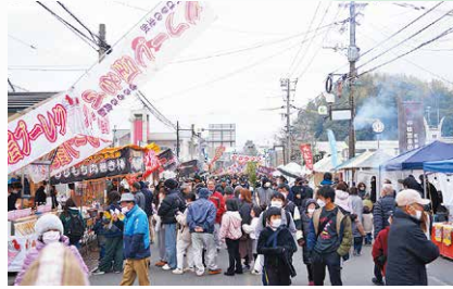
1月 くしら二十三や市 3年ぶりの開催となった、くしら二十三や市。串良総合支所前に約150店の出店が並び、約2万8,600人が来場しました。