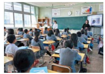
▲1月に国立台北教育大学の教育実習生が授業を行った際には、円滑に授業が行われるよう児童のサポートを行いました

主人がアメリカでホームステイをしながら現地の学校に通っていたので、台湾の子をぜひ受け入れてみたいという気持ちがありました。実際にホストファミリーを経験して、英語でコミュニケーションを取ることの難しさや食文化の違いなどを感じましたが、翻訳アプリを使いながらなんとか会話をし、私自身にとっても、子どもにとっても貴重な経験になったと感じています。今後もこのような異文化交流の機会があれば、積極的に家族で参加し、英語に触れていきたいです。