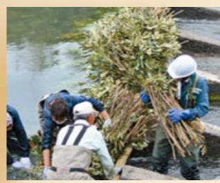
▲堰をつくる伝統技法は、この地域に春を告げる風物詩となっており、この日を境に一気に田植えが本格化する

川原園井堰は、江戸時代初期に薩摩藩の新田開発により現在の場所に作られました。原型は大きな木の杭を直接川床に打ち込み、束ねた柴を杭の間に配置する形式でしたが、明治期に石基礎への改築工事が行われました。しかし、この石基礎は大きな洪水のたびに流出し、昭和24年に発生した台風による集中豪