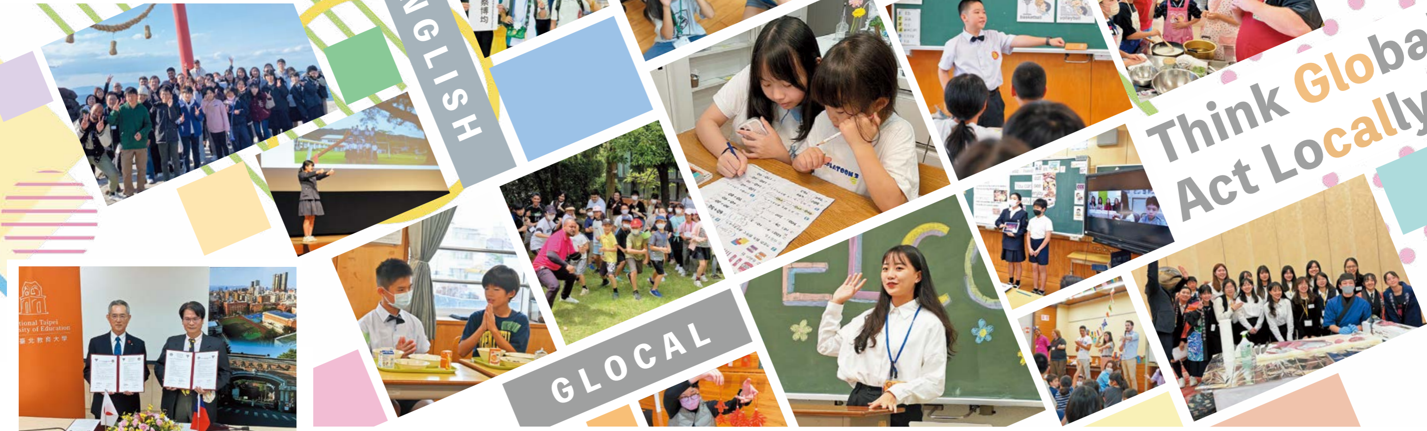
▲令和4年12月に台湾で行われた国立台北教育大学と市教育委員会の協定締結の様子

また、台湾の小学校10校と市内小学校もそれぞれ協定を締結しており、ICTを活用した台湾とのオンライン授業や発表動画などの交換を行っています。今年度は7月4・5日にチャンダウバイリンガル小学校が西原小学校、11月2・3日にシュアンヨン小学校が立台北教育大学附属小学校が鹿屋小学校と東原小学校を実際に訪問し、英語の授業や給食等での対面交流、児童宅でのホームステイを