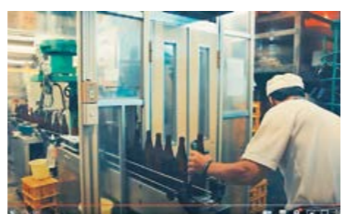
YouTube 動画「坪水醸造」ではこだわりの製法や地域との関わりについて紹介している

どのコスト面を考えた結果、国内で使われるような液体のしょう油などの商品をそのまま提供するとは難しいと思っています。粉末の調味料であれば、輸出のコストを抑えながら海外でブームとなっている和食料理店などで調味料として使っていただけの場合、粉末だからこそできる調味料としても大きな可能性のある商品だと思っています。これからは、従来の形にと