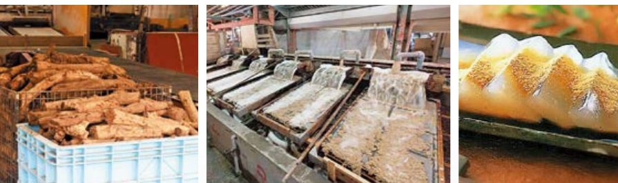
【左】掘り子さんから買い取った寒根かすら。昔は600人いた掘り子さんも、現在は30人程になっており、随時掘り子さんを募集している状況 【中・右】細山田にある鹿児島工場では、寒根かすらを粉碎、葛デンプンを抽出し、粗葛になるまでを製造。その後、秋月に持ち帰り製品化される