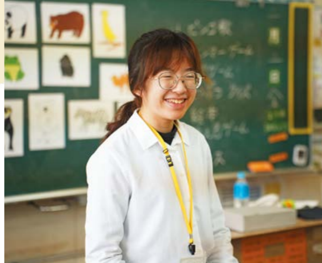
国立台北教育大学