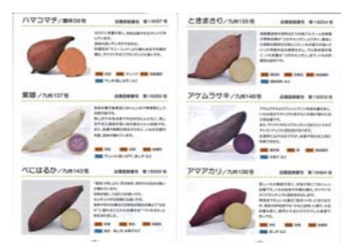
▲青果用・焼耐用・加工用など、用途に応じた品種をそろえている

そのため、生育が良く植えるまで病害の心配がほとんどないことから、人気の高い商品となっています。 弊社の一番の強みは、取り扱っているバイオ苗の種類の豊富さ。現在販売しているサツマイモのバイオ苗の品種は約60種類で、これだけの品種を取り扱っている法人は稀だと思えます。 今後、サツマイモの品種は増えていくことが予想され