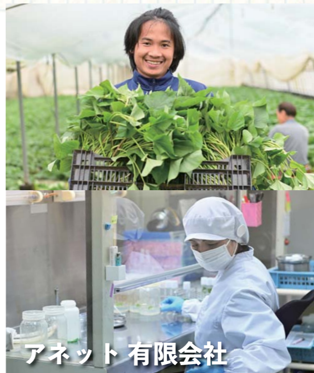
アネット 有限会社

「バイオ苗」で病害に強い芋を ココに注目!! バイオ苗（ウイルスフリー苗・茎頂培養苗）とは、サツマイモ苗のつるの先端0.3〜0.5mm部分の組織（成長点）を無菌状態の試験管で培養し、成長させた種苗のことです。 主にサイズが大きく形の良いサツマイモの種苗が使われ