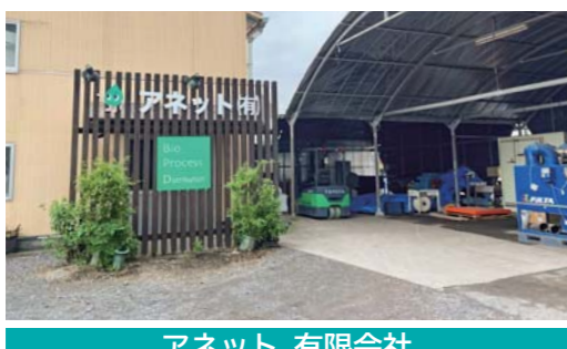
アネット 有限会社