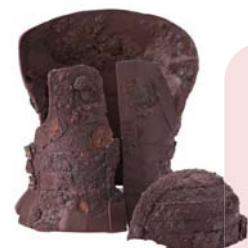
串良ふれあいセンター所蔵

市内で初めて群集する地下式横穴墓が確認された遺跡で、昭和 25 年に短甲・衝角付冑が出土。それらは県指定有形文化財にもなっている。