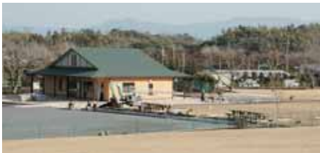
7月のオープンを目指し整備が進むグラウンド・ゴルフ場。

健康・スポーツの交流拠点の形成や市民の生涯スポーツの振興を目的に、田崎町に整備を進める8コース64ホールグラウンド・ゴルフ場が、いよいよ今年7月にオープンします。 そこで、市では、このグラウンド・ゴルフ場と8つのコースにふさわしい愛称を募集します。