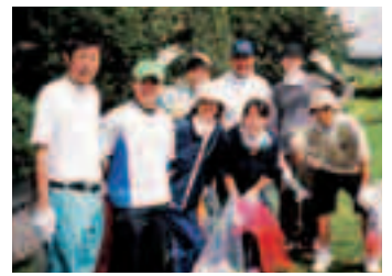
吾平町青年団 ボランティア活動などを行っています。現在、団員募集中!