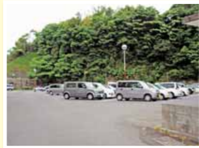
ハローワーク専用駐車場