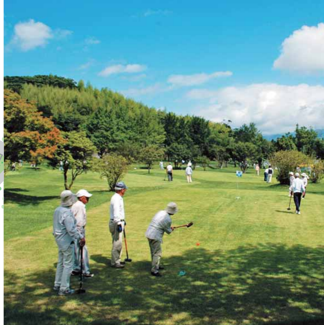
グラウンド・ゴルフを楽しむオープンを待ちわびた大勢のプレーヤー（こすもすコース・6番ホール）

田崎町に、日本最大級のグラウンド・ゴルフ場の専用競技場「かのやグラウンド・ゴルフ場」が、7月1日にオープンしました。自然の地形を生かして造られた同グラウンド・ゴルフ場を、ぜひ、ご利用ください。