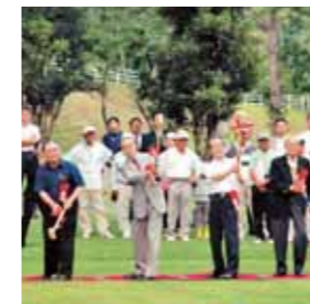
オープンを記念して行われた始打式

また、同グラウンド・ゴルフ場は、平成20年10月に開催される第21回全国福祉健康祭がこしあ大会「ねりんピック鹿児島2008」のグラウンド・ゴルフ競技の会場となっています。木陰に恵まれ、自然の地形を生かして造られた「かのやグラウンド・ゴルフ場」を、ぜひ、ご利用ください。