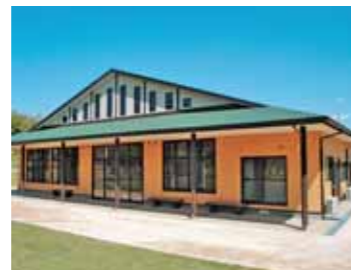
休憩室もあるクラブハウス