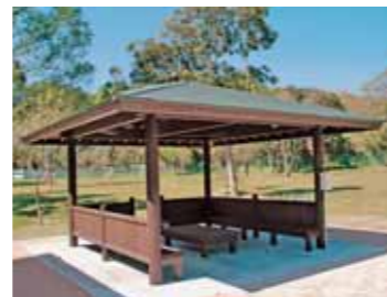
プレー中に休憩ができる東屋