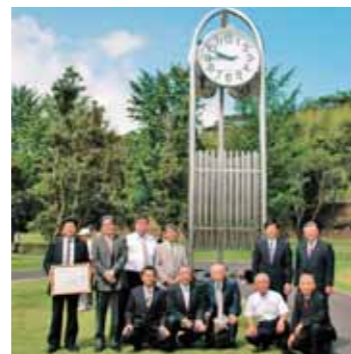
鹿屋ロータリークラブが時計台を寄贈