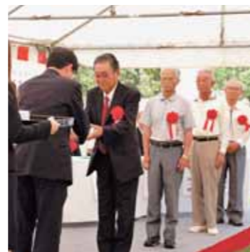
グラウンド・ゴルフ場と各コースの名付け親を表彰