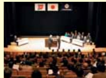
12月4日に行われた辞令伝達式

平成19年12月1日付けで委嘱を受けた新しい民生委員・児童委員、主任児童委員を紹介します。