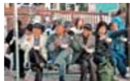
当日は、豚汁とそばが無料振舞われました。