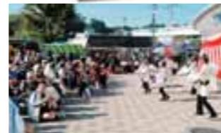
ダンスなどが披露され、朝市を盛り上げました。