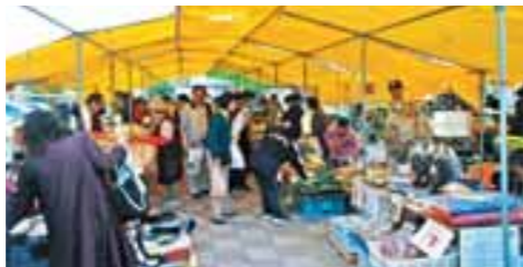
朝市には、多くの買い物客が訪れました。