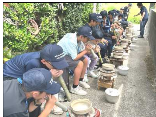
海水から塩づくり体験