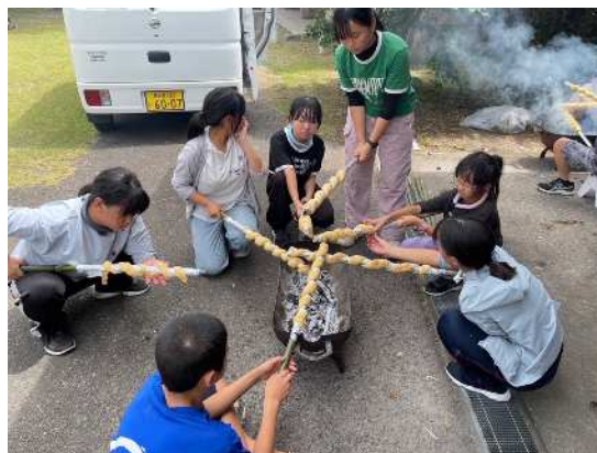
【まきまきパンづくり】