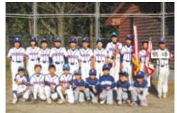
鶴峰ソフトボールスポーツ少年団 吾平町上名 「火・木・土曜日練習しています。 団員募集中!」