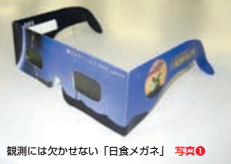
観測には欠かせない「日食メガネ」 写真①