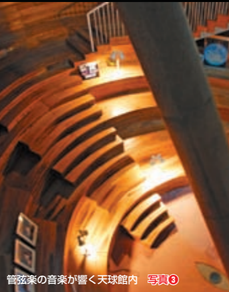
管弦楽の音楽が響く天球館内 写真③