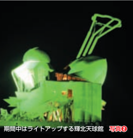
期間中はライトアップする輝北天球館 写真②