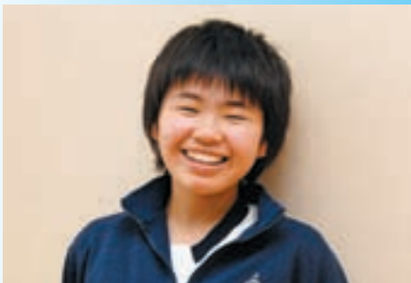
「貴重な日食観測が楽しみです」

今回の皆既日食が見られる地域ですが、日本では、鹿児島県のトカラ列島を中心とした島々になります。それ以外の日本各地では、太陽が部分的に隠される部