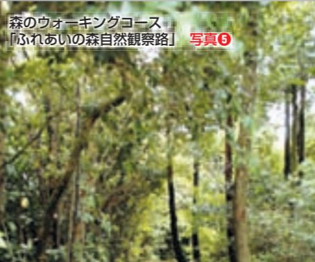
森のウォーキングコース「ふれあいの森自然観察路」 写真⑤