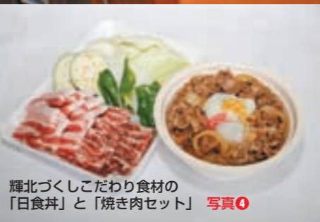
輝北づくしこだわり食材の「日食丼」と「焼き肉セット」 写真④